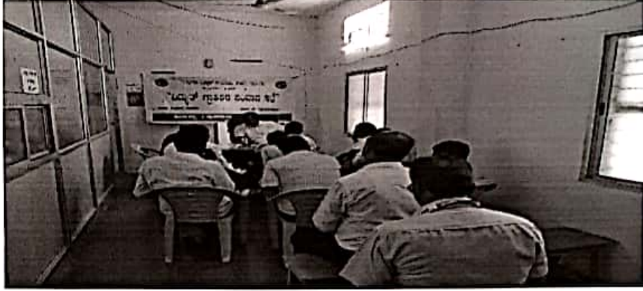
“ವಂದನಾರ್ಪನೆಗಲೊಂದಿಗೆ ಸಭೆಯನ್ನು ಪೂರ್ಣಗೊಳಿಸಲಾಯಿತು”

ಕ್ರಮ : ನದರಿ ಬಿಡ್ಡಯದ ಉರಿತು ಶಾಖಾಧಿಕಾರಿ ರವರಿಗೆ ಸ್ಥಳ ಪರಿಶೀಲಿಸಿ ಬಿದ್ಯುತ್ ಸಂಪರ್ಕ ಕಲ್ಪಿಸಲು ಸೂಚಿಸಲಾಯಿತು.